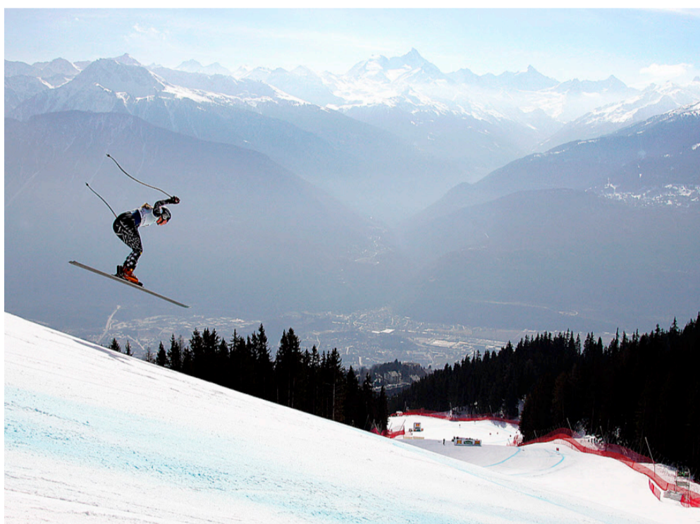
Die pickelhart präparierte Piste Nationale – und immer das Alpenpanorama vor Augen.

Und man will sich mehr um Familien mit Kindern kümmern, nicht mehr nur um Prominente wie Alain Delon oder Roger Moore: Kinderbetreuung wird angeboten; Schlitteln, Eislaufen, Schneewandern und andere «sanfte» Sportarten werden propagiert. (akv)