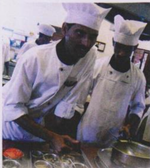
„Interactive Cooking“ – der Chefkoch persönlich erklärt interessierten Gästen, wie die typisch indischen Speisen zubereitet werden, und lässt sie am Herd herumexperimentieren. Er hat sogar ein eigenes Kochbuch herausgebracht.