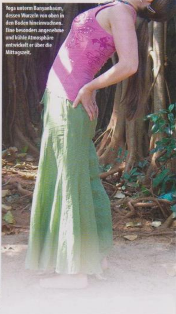
Yoga unterm Banyanbaum, dessen Wurzeln von oben in den Boden hineinwachsen. Eine besonders angenehme und kühle Atmosphäre entwickelt er über die Mittagszeit.