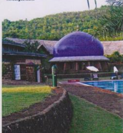
Im BlueDome findet die tägliche Meditationspraxis statt.